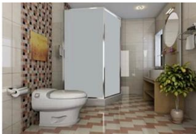
Vidro de privacidade segurança inteligente para parede de vidro