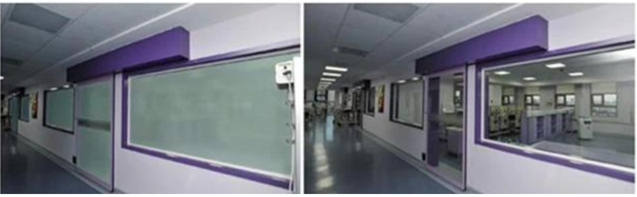
Tamanho pequeno smaple de vidro inteligente do filme: