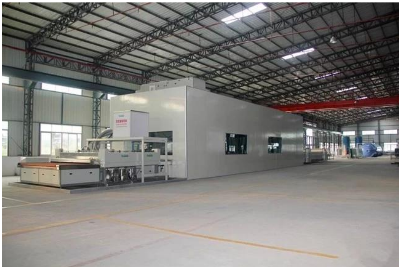
Embalagem da segurança do vidro laminado