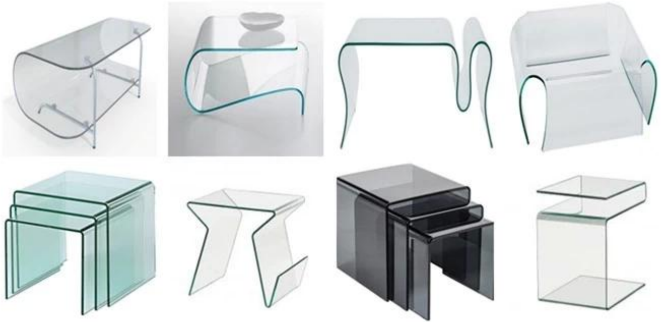
Bükülmüş tavlanmış cam uygulaması