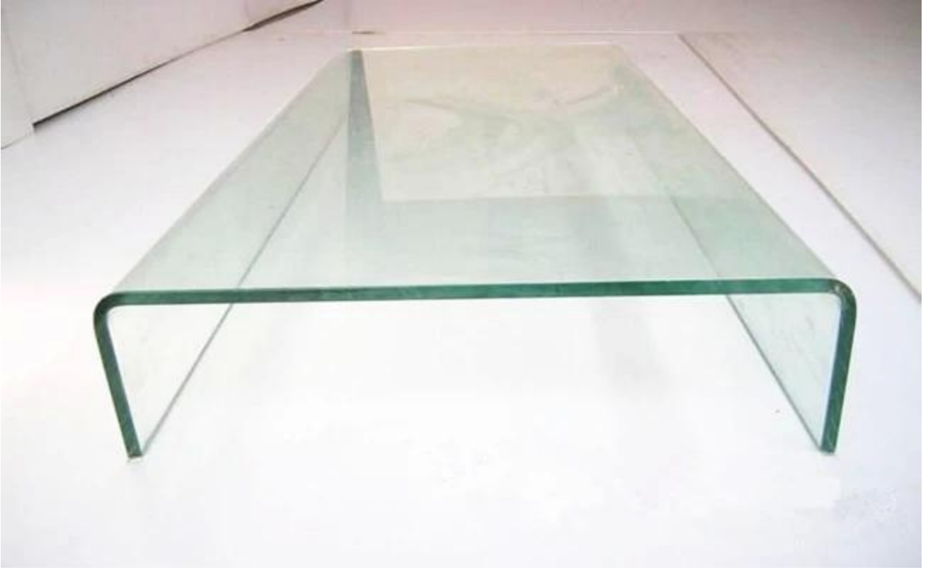
Farklı şekillerde kavisli tavlı cam