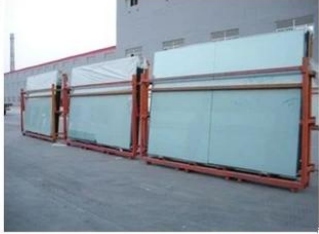
Asit Katkı Camı Güçlü Ambalaj