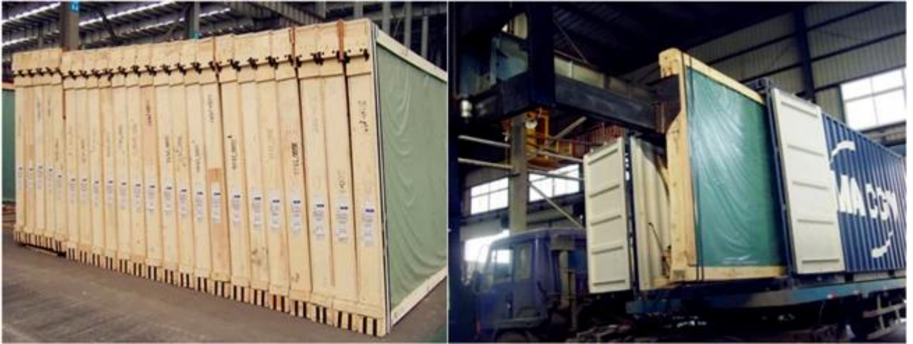
Renkli dekoratif lamine cam bina için