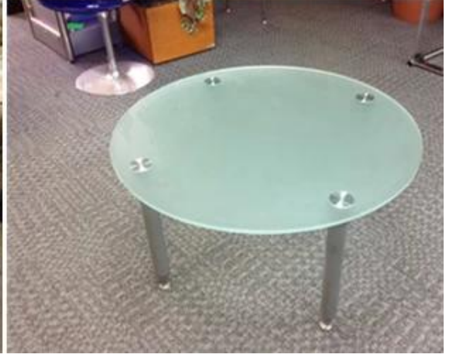
Kenar ve köşe parlatılmış