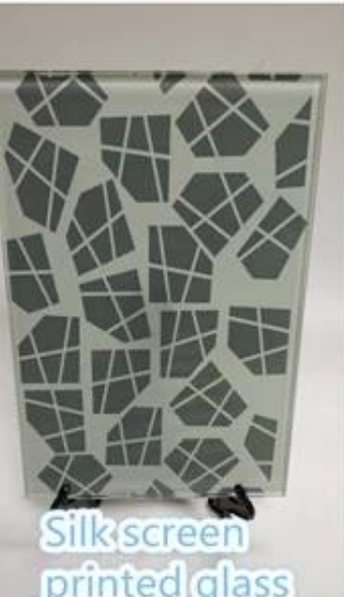
Silk screen printed glass