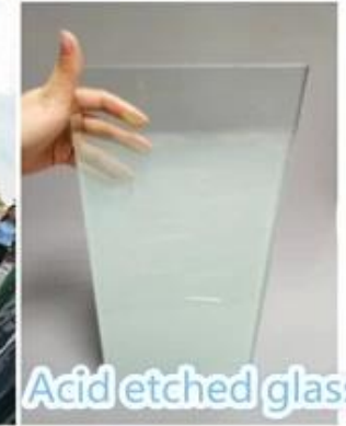
Acid etched glass