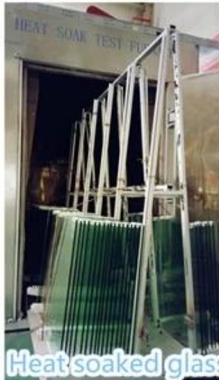
Heat soaked glass