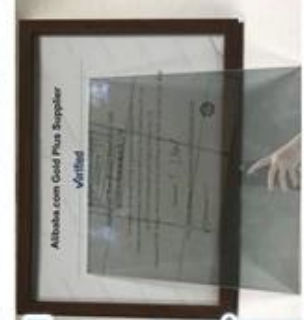
Two way mirror