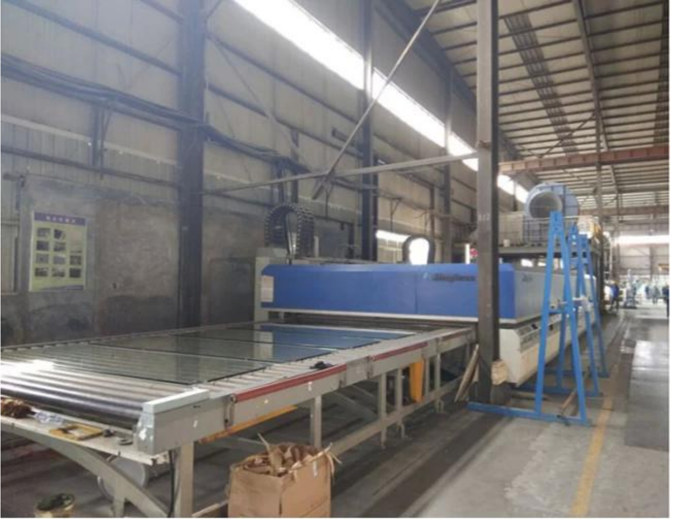
paketleme kavisli huylu bardak