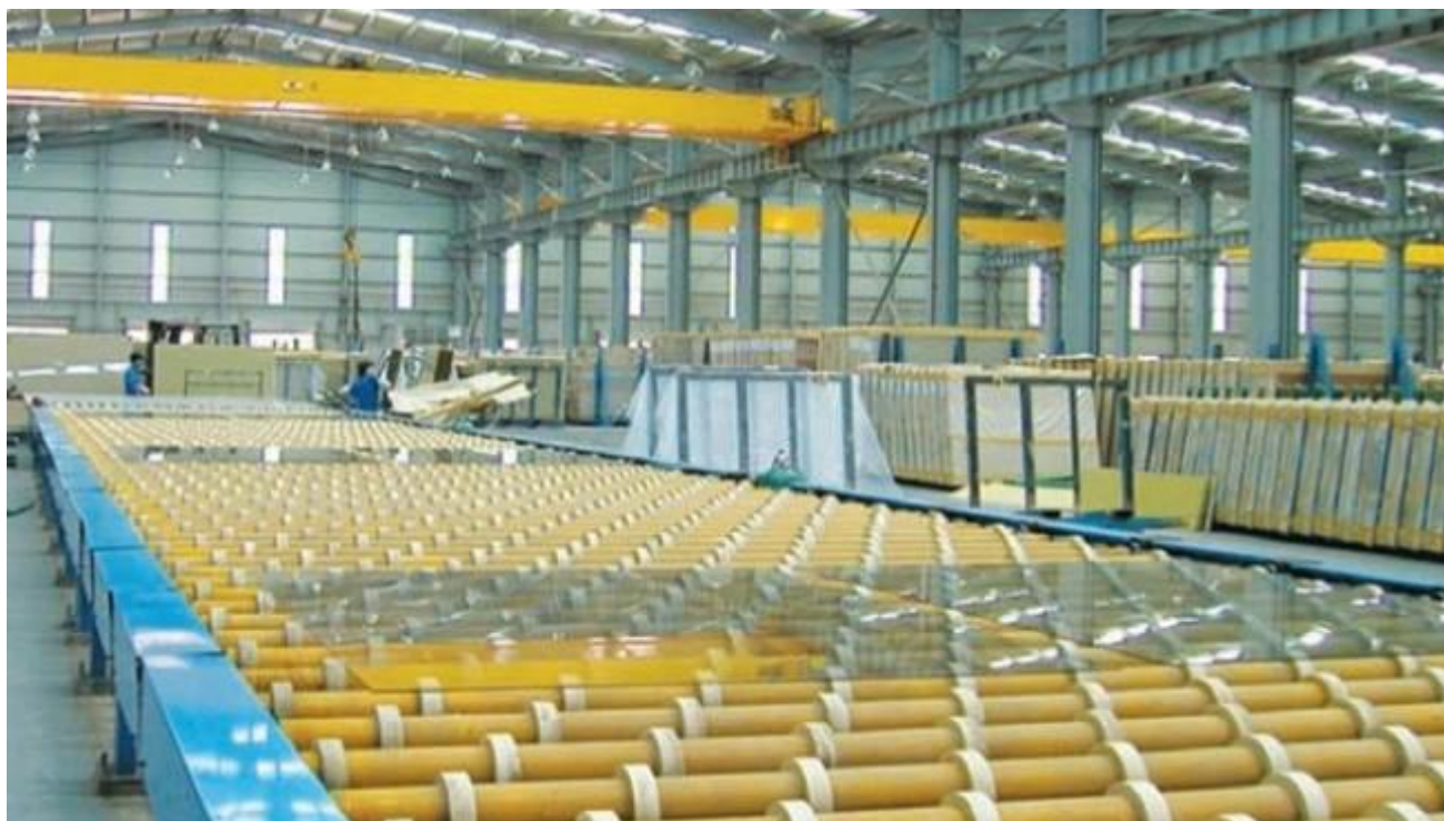
Float bao bì thủy tinh