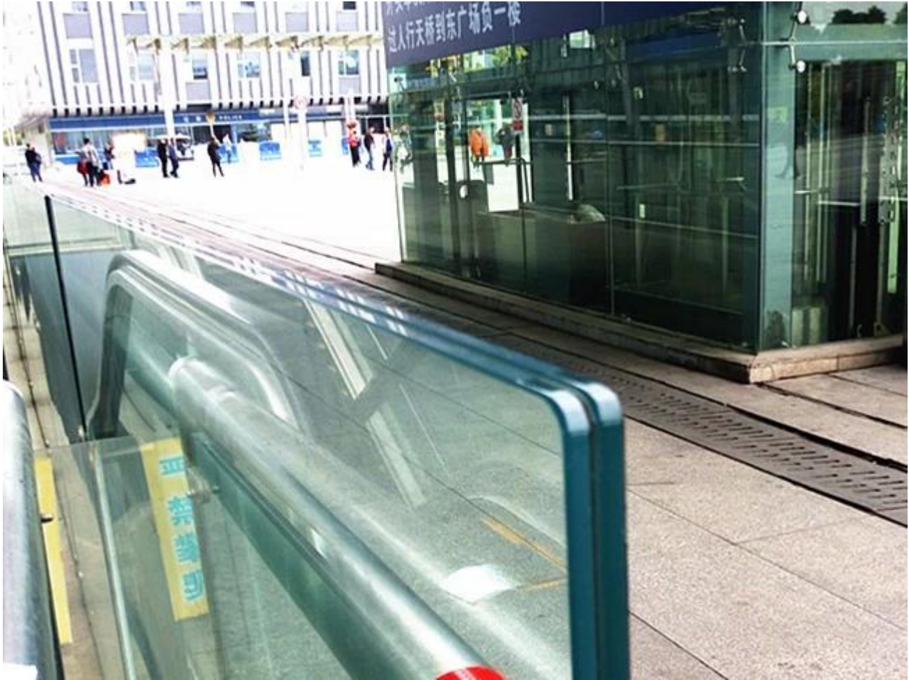
13.14mm Clear PVB Laminated Glass Sử dụng Đối với Canopy: