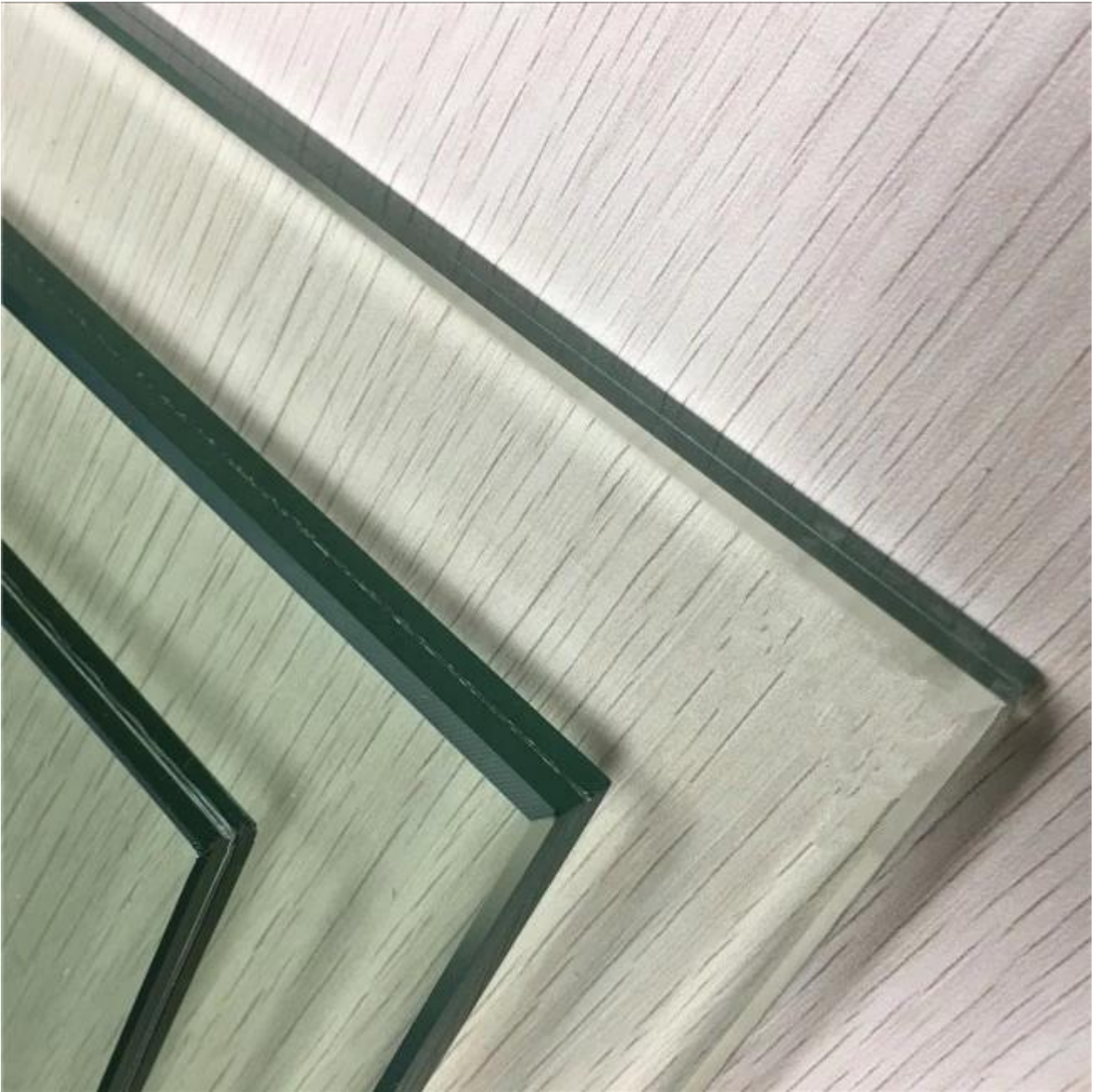
Kính an toàn với Cutouts và lỗ