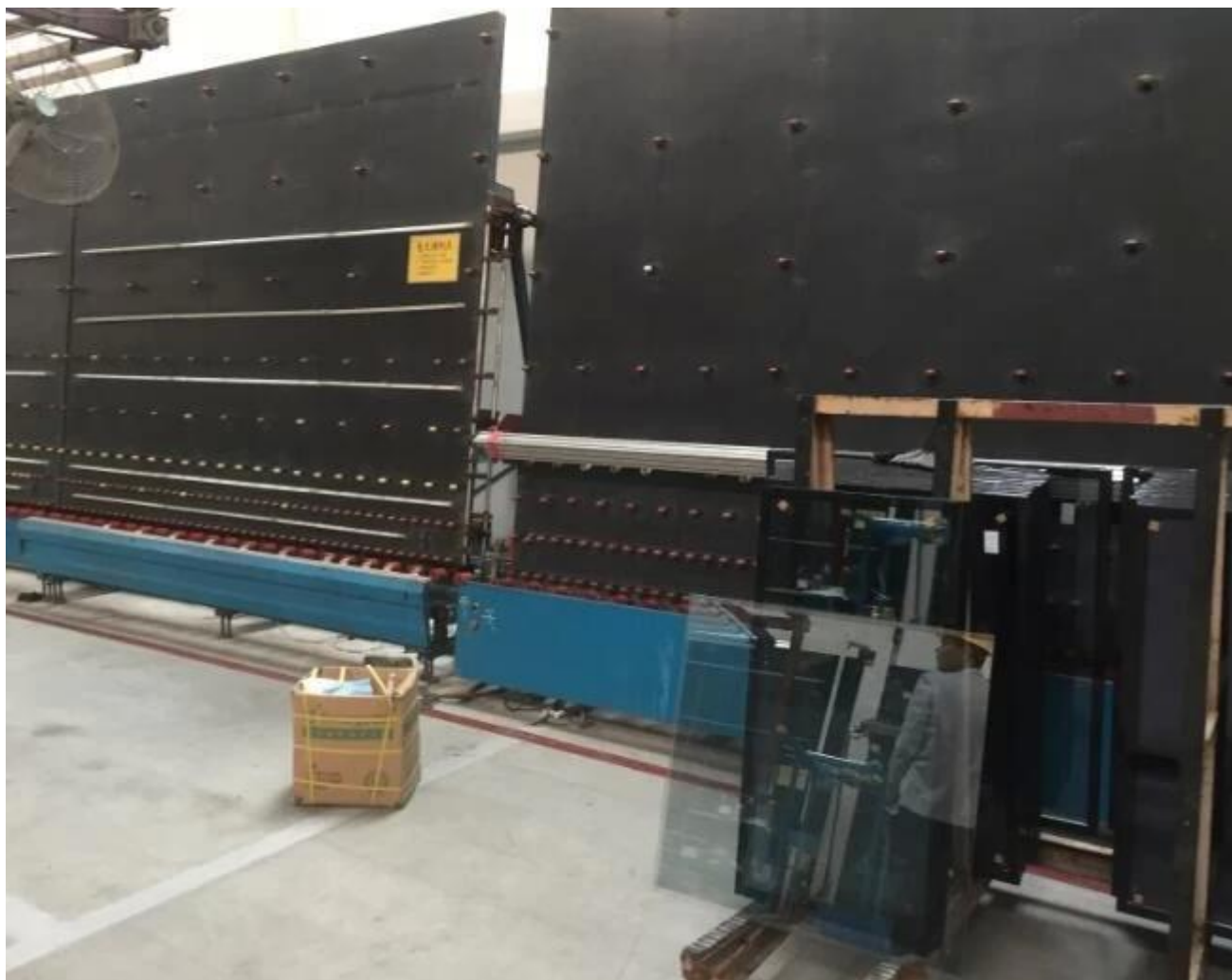
Đóng gói và Nạp bởi Jimy Glass