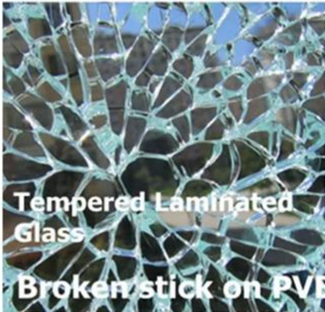
Tempered Laminated Glass