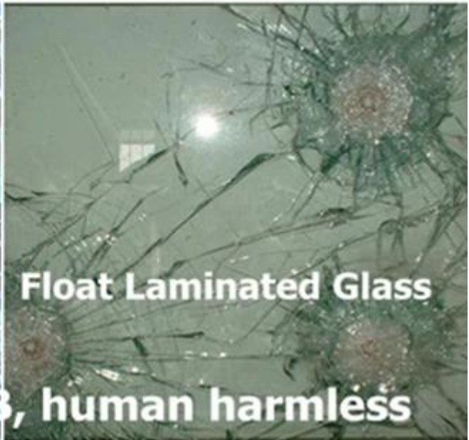
Float Laminated Glass

Kính dán an toàn Tempered nhà máy sản xuất thủy tinh