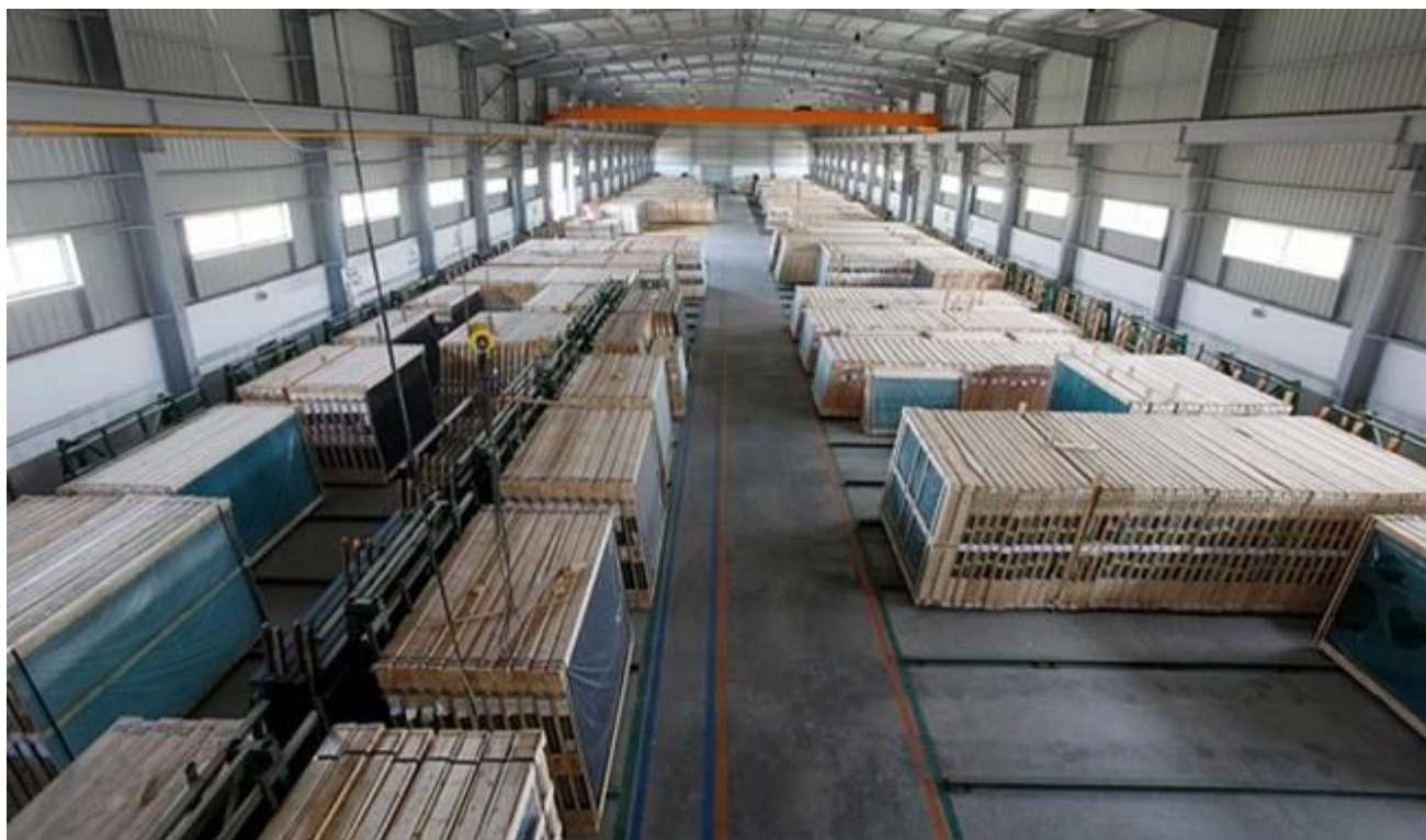
Phao kính an toàn tải