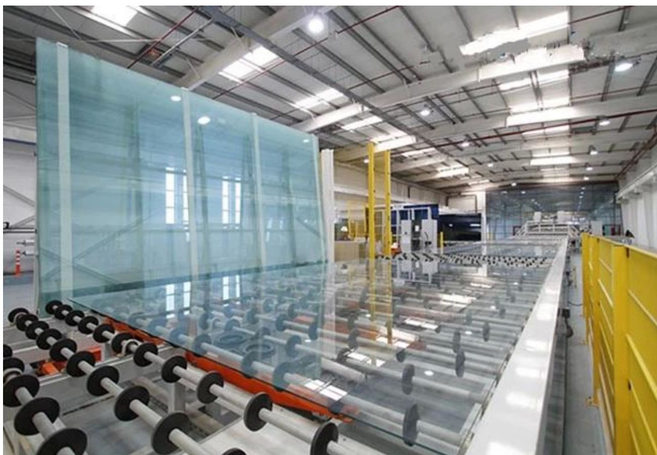
Phao kính mạnh mẽ gỗ thùng bao bì