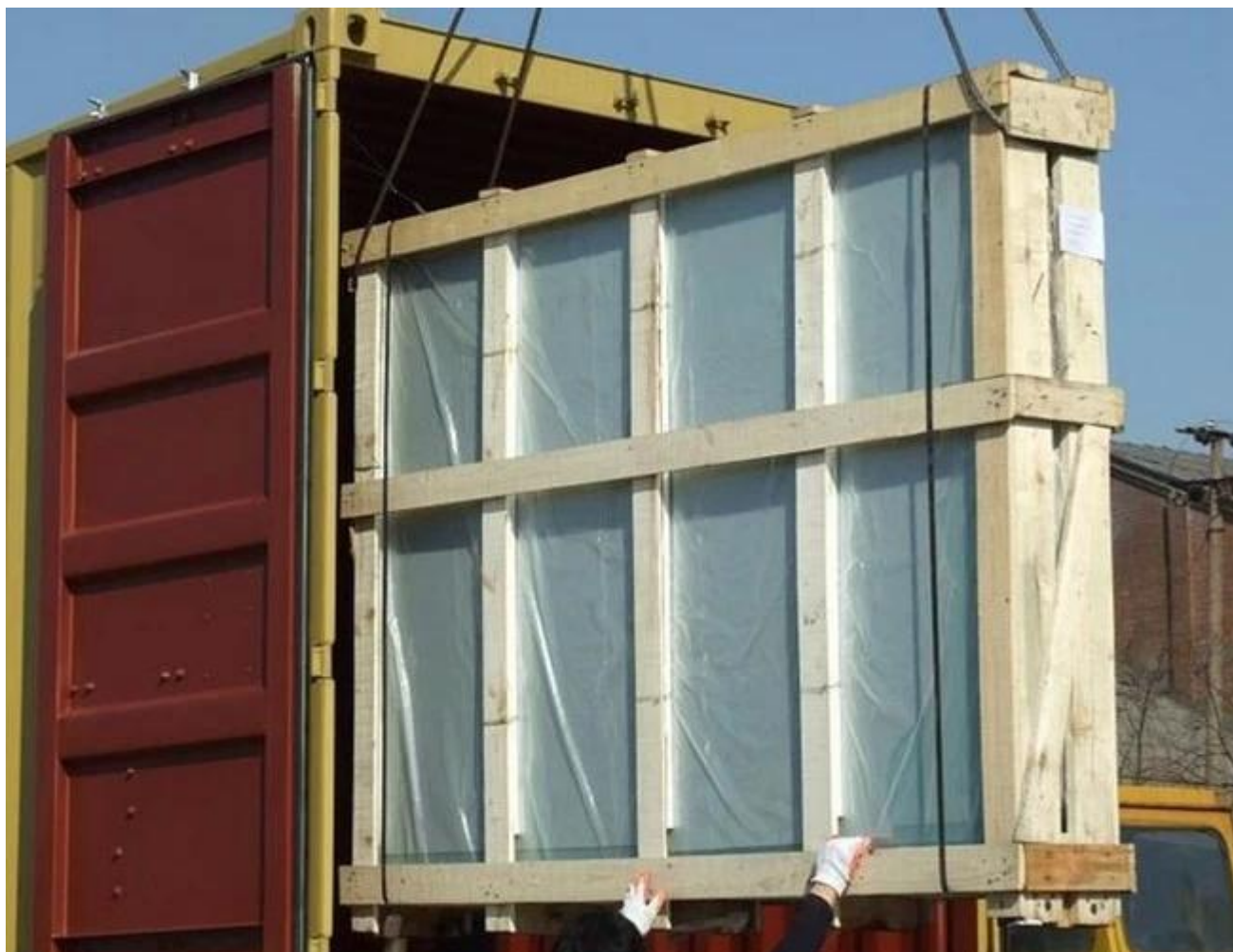
Nhà máy Hiển thị Thâm Quyến JIMY thủy tinh