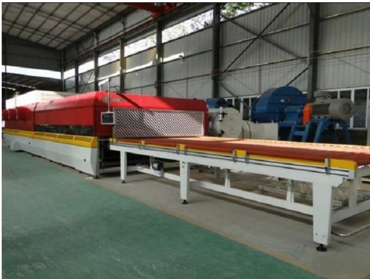
Kính thủy tinh luyện mạnh gỗ thùng bao bì.