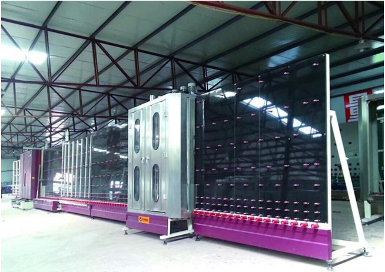
Kho hàng thủy tinh cách nhiệt