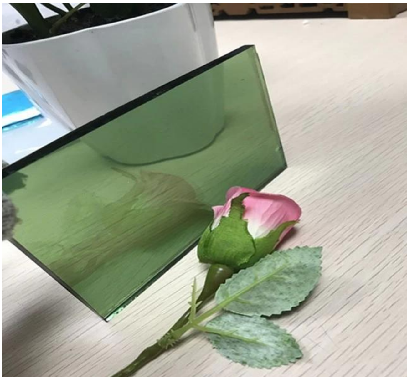
Kính phản quang ánh sáng màu xanh lá cây và thủy tinh phân chiếu xanh đậm