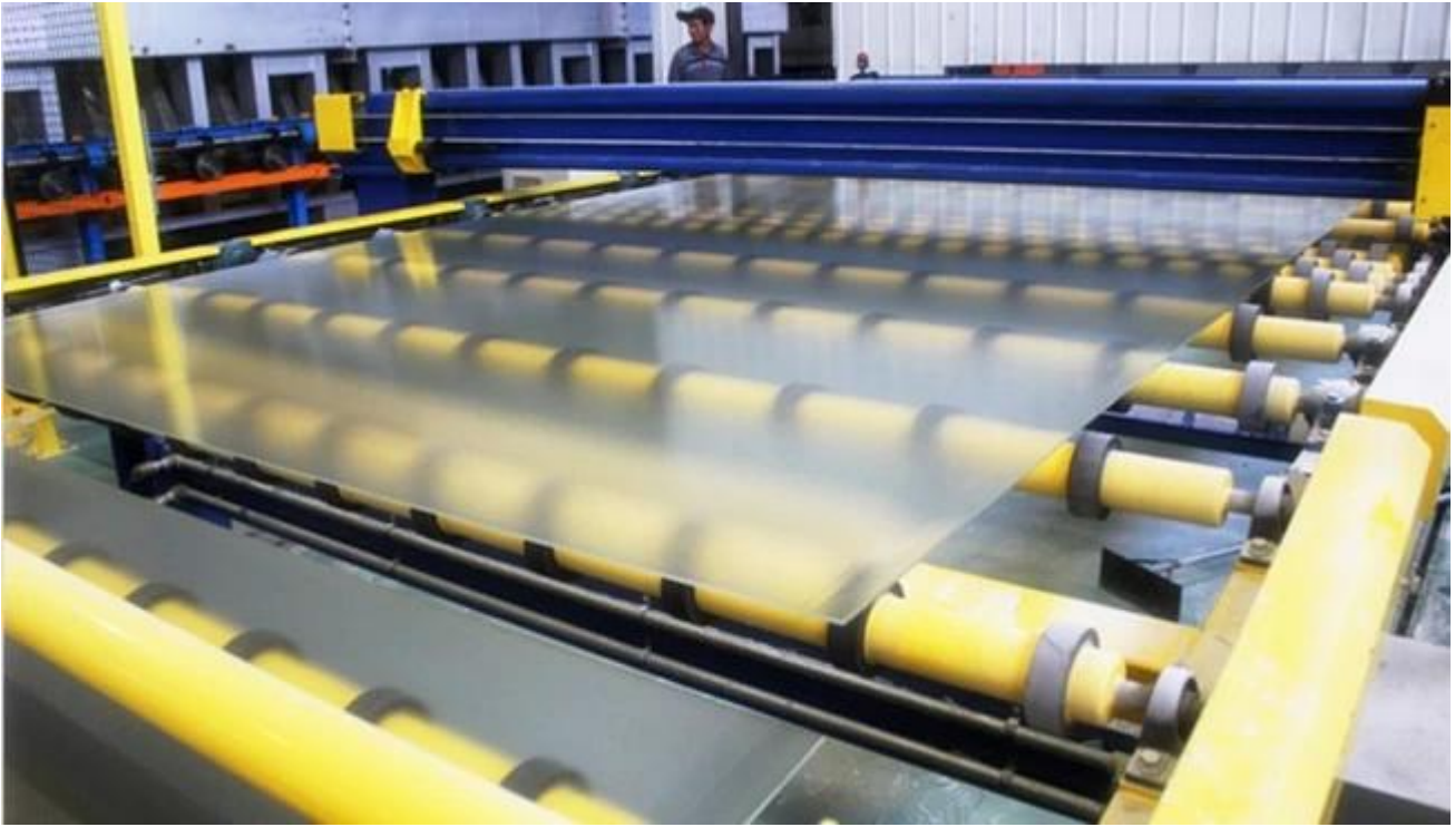
An toàn đóng gói và tải