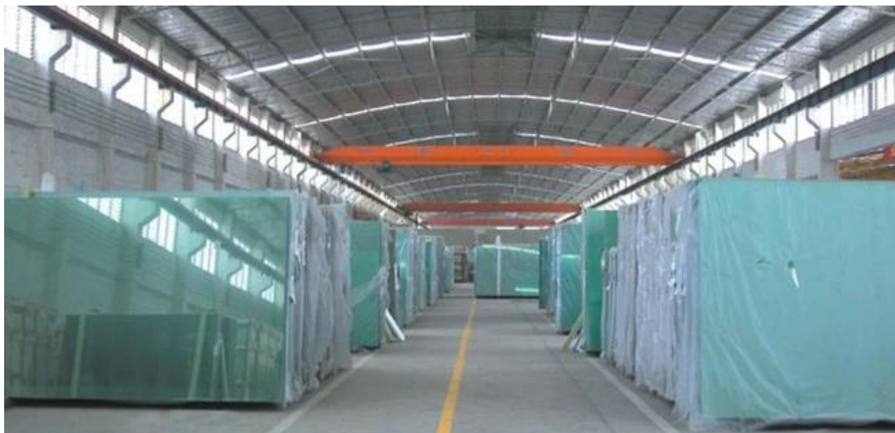
An toàn các bao bì Jimy Glass nhà máy: