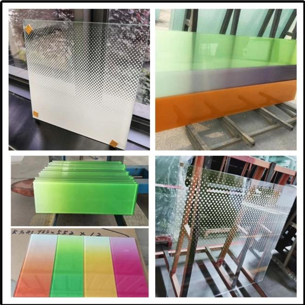
Hình ảnh sản xuất kính trang trí nội thất 12 mm