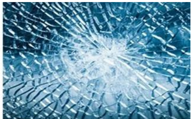
Tempered glass breaks into many small pieces with less sharp edges.