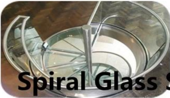
Spiral Glass Stair Railing