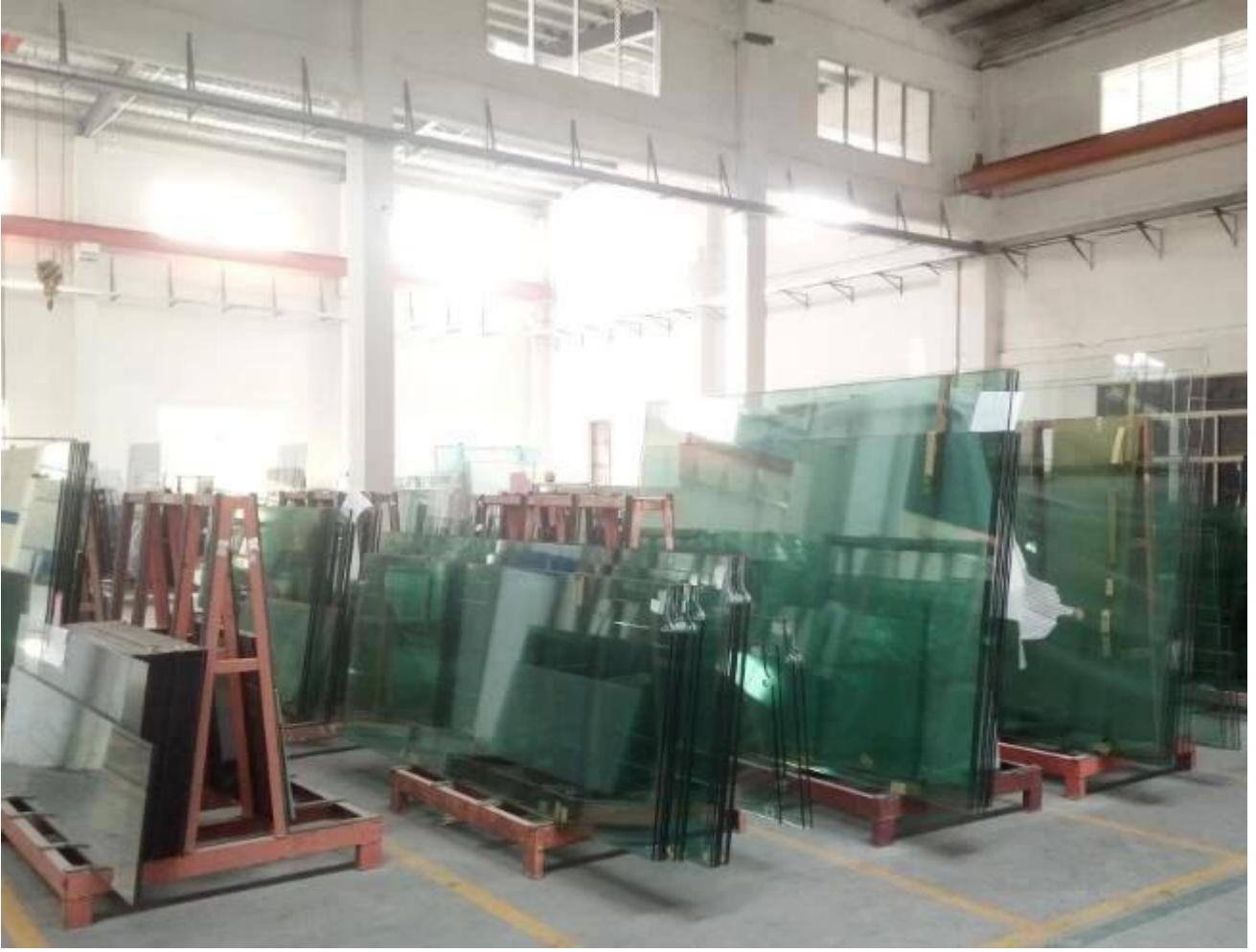
الحرارة غارقة الزجاج خفف الصانع الصين