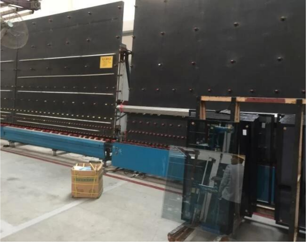
التعبئة والتغليف والتحميل من قبل جيمي الزجاج