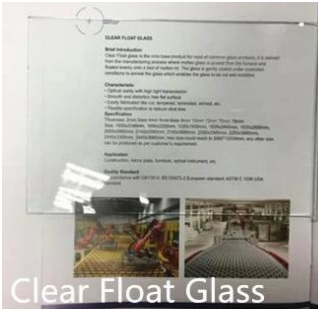
Clear Float Glass