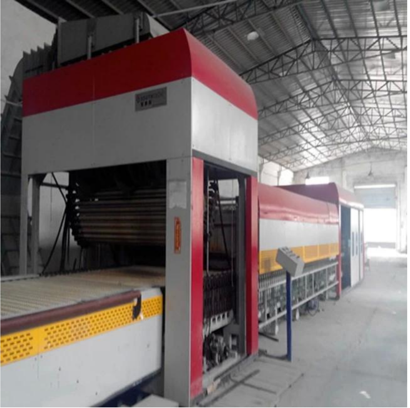
مصنع لإنتاج الزجاج مغلفة