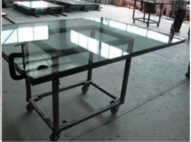
الزجاج المعزول تطبيق Low E: