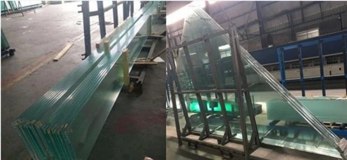
JimyGlass العبوات الزجاجية من قبل