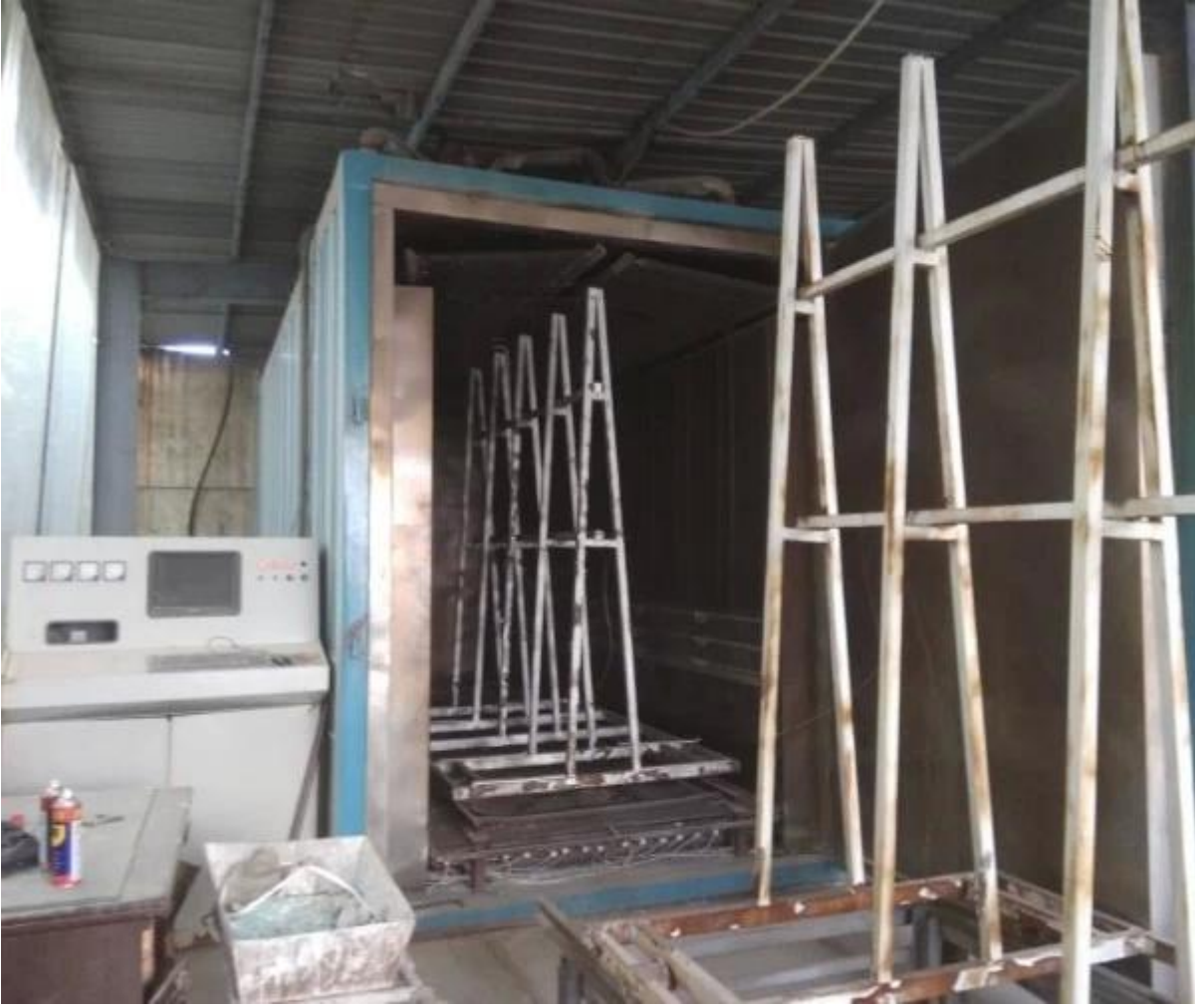
جودة عالية الحرارة غارفة الزجاج المقسى