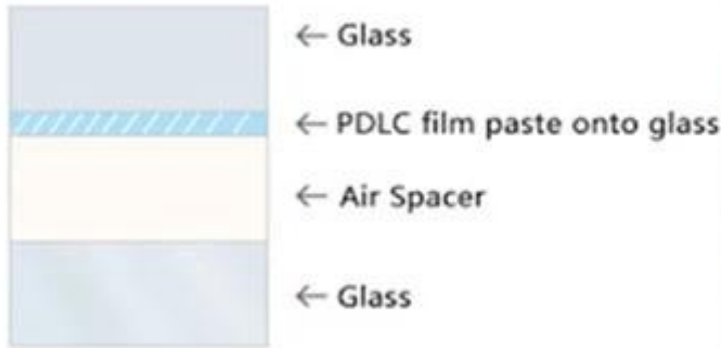
switchable IGU option A