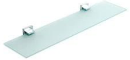
JimyGlass قم بتحميل الحاوية بواسطة