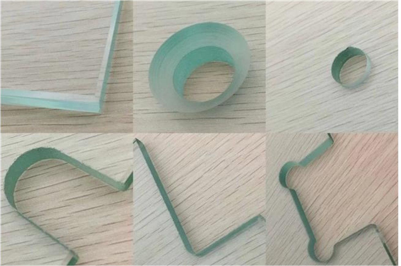
سلامة خفف الزجاجات التطبيق: