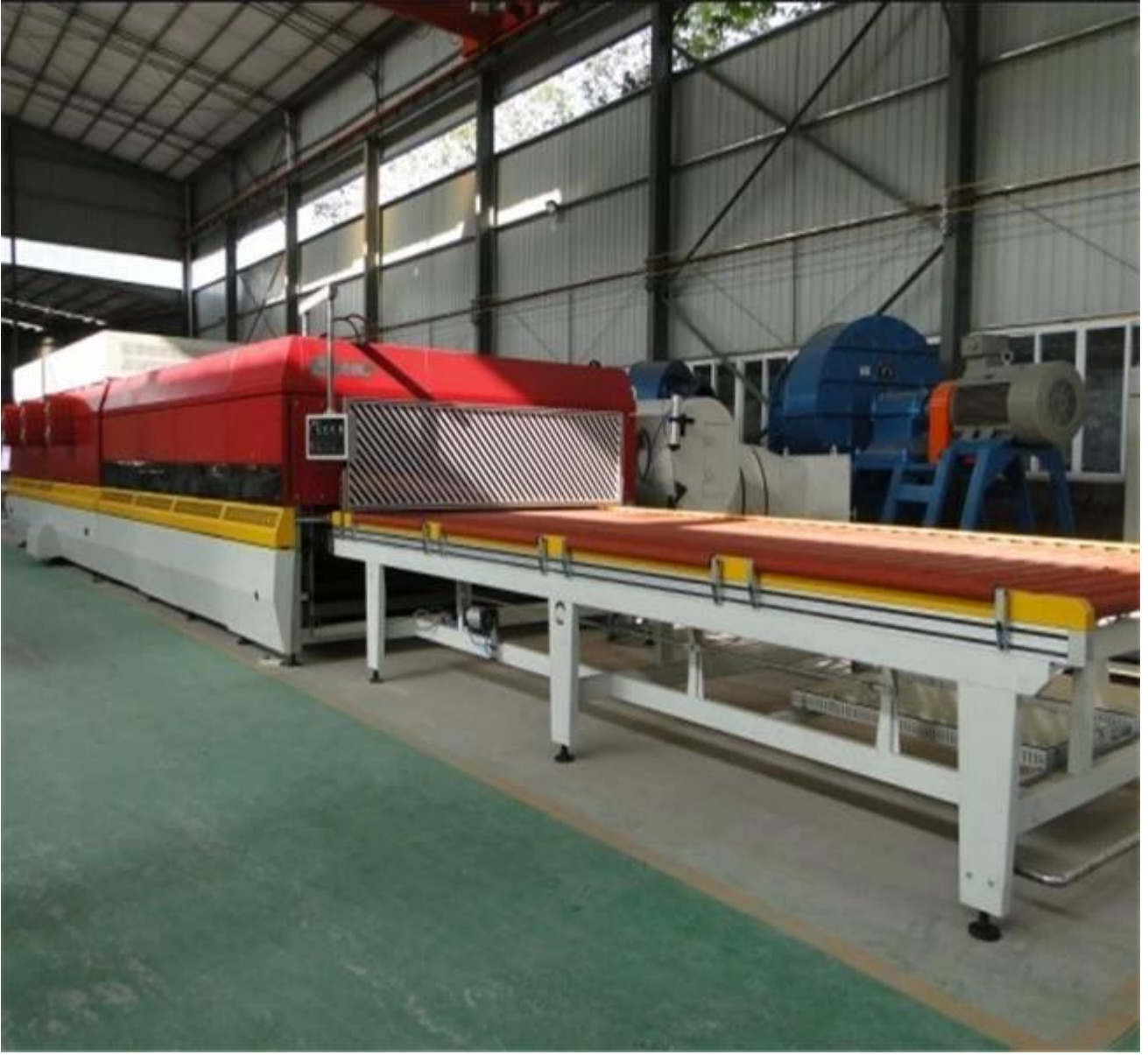
اللون الأخضر الزجاج المقسى -- f-mm حزمة من 6