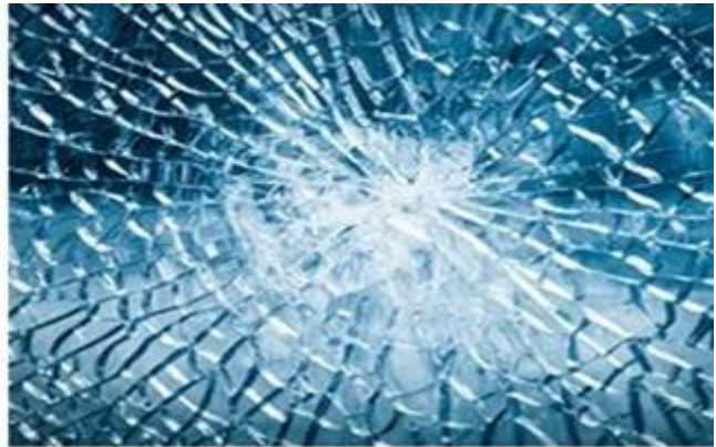
Tempered glass breaks into many small pieces with less sharp edges.