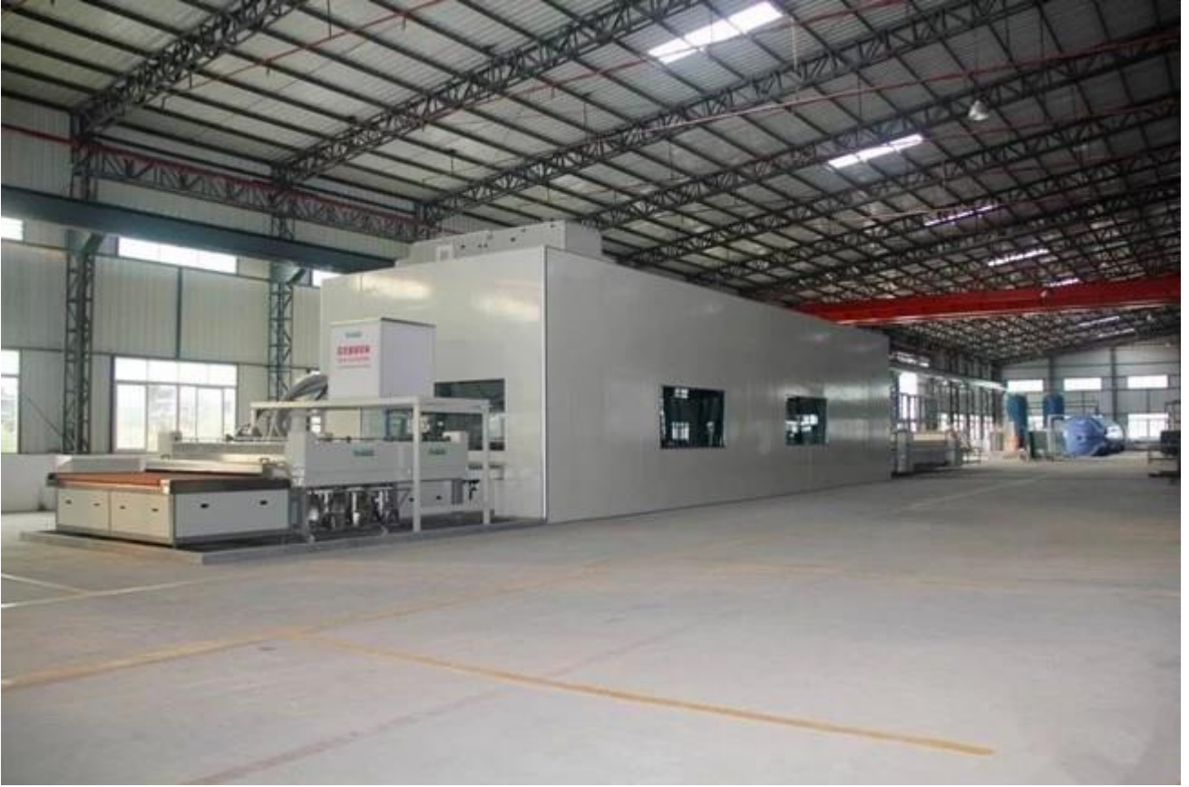
الزجاج مغلقة سلامة التعبئة