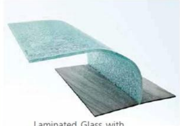
Laminated Glass with PVB Interlayer