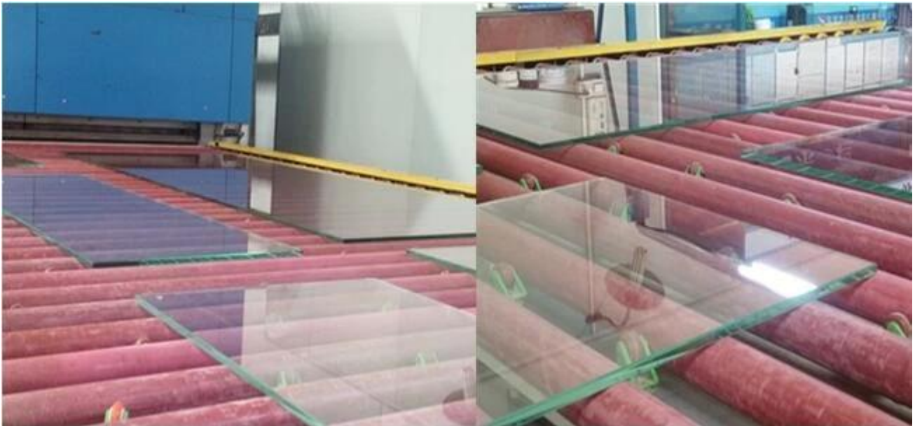
Gehärtetes Glaslager von Jimmy Glass