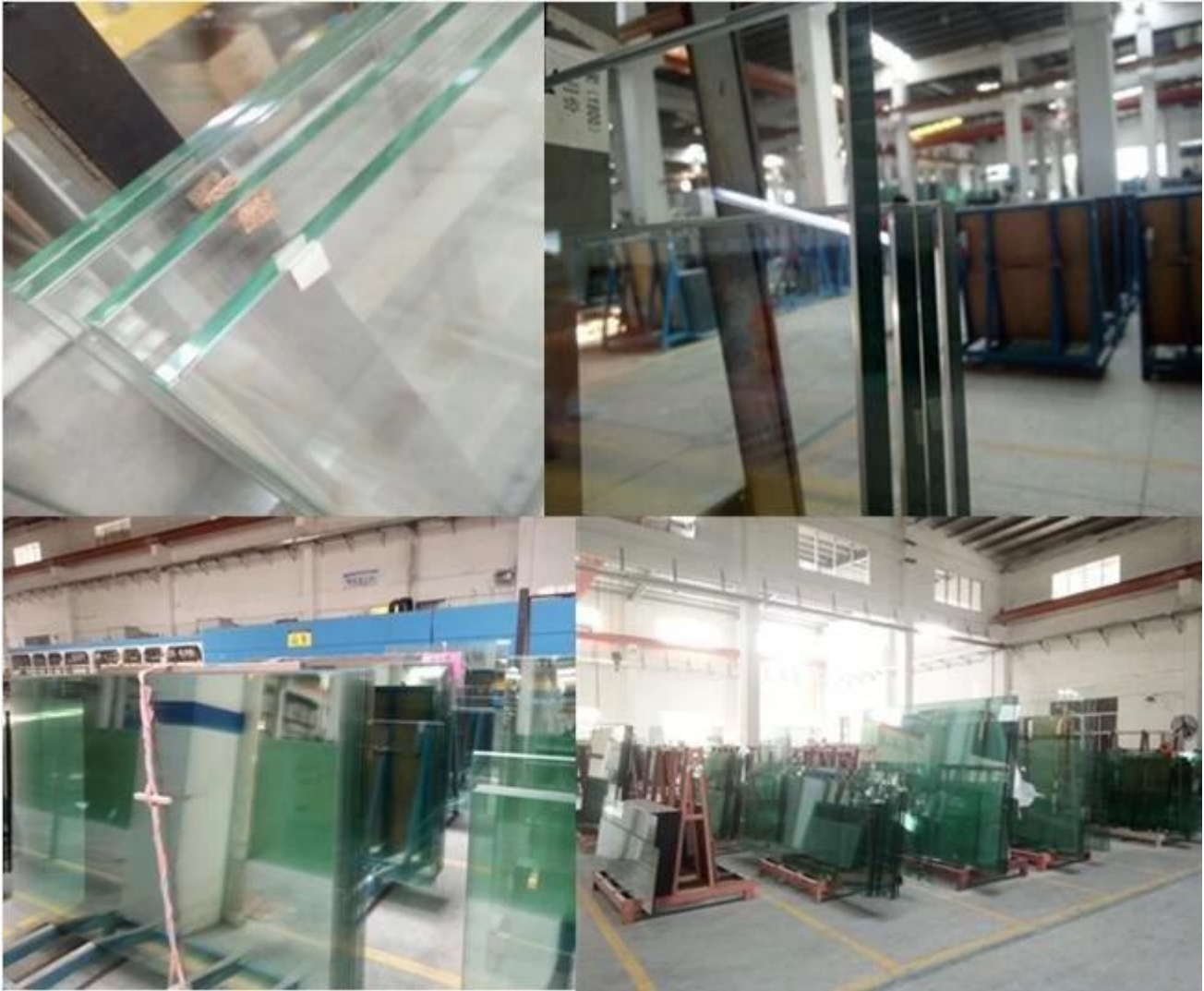
Verpackung und Beladung durch Jimmy Glass