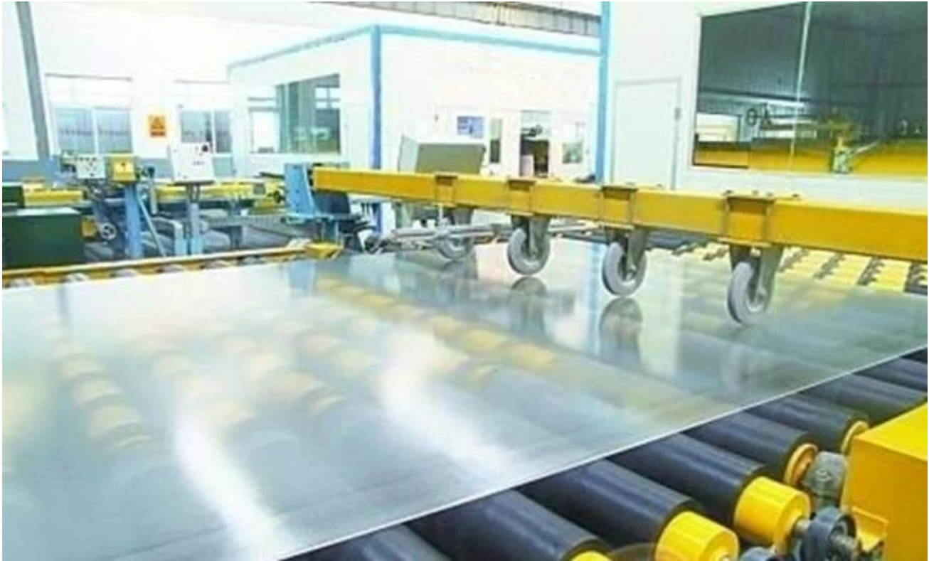
Ornamentglas Sicherheit, Verpackung und Verladung