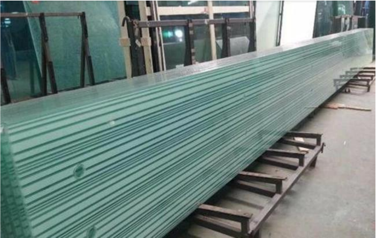
6 + 6mm Green-Square nicht transparentes Siebdruckglas für die Balustrade