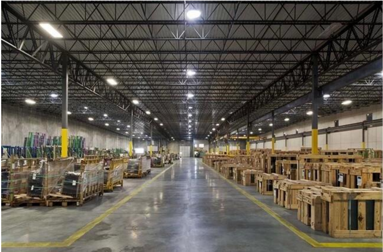
Verpackung und Beladung durch Jimy Glass Fabrik