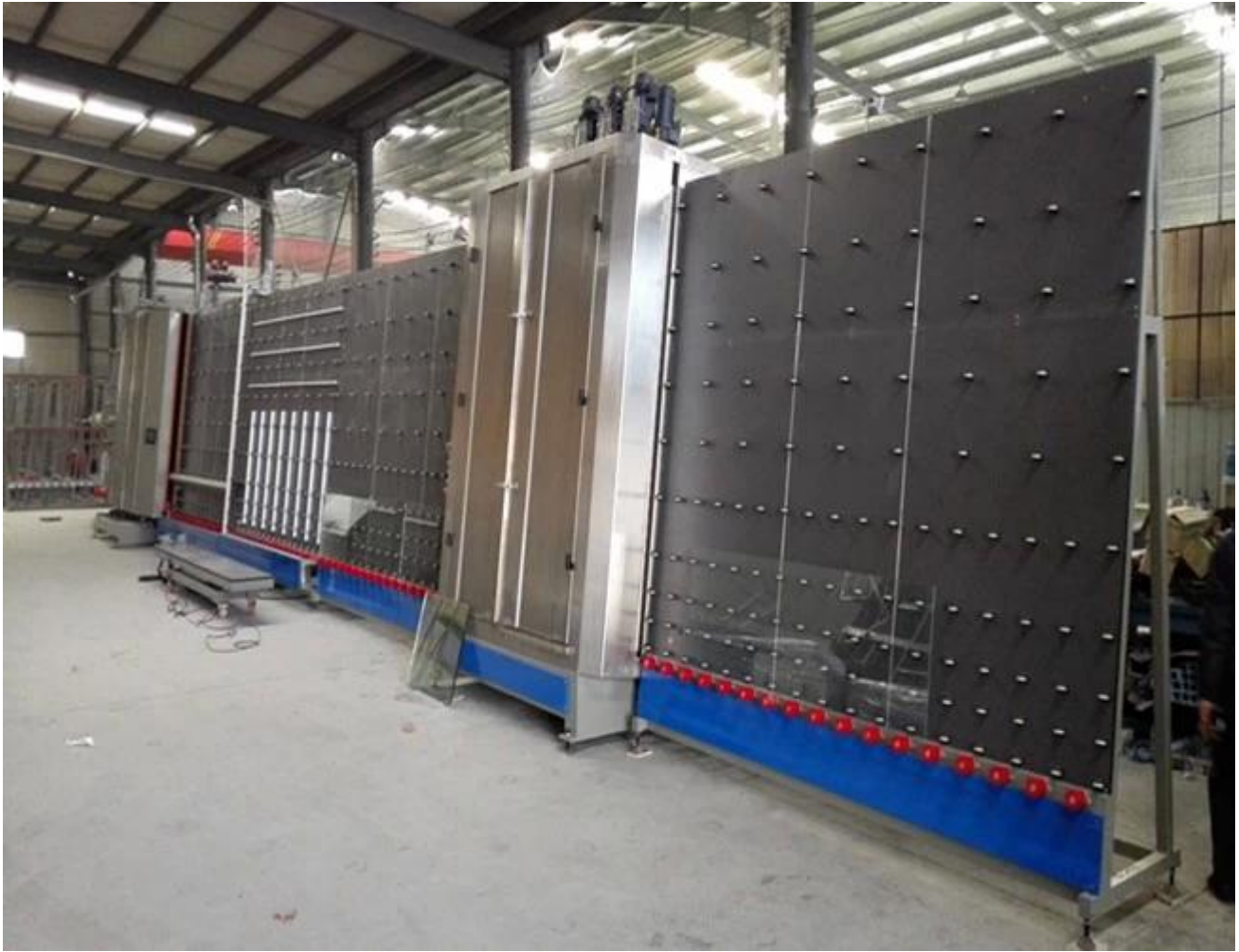
Starkes Paket aus Isolierglas