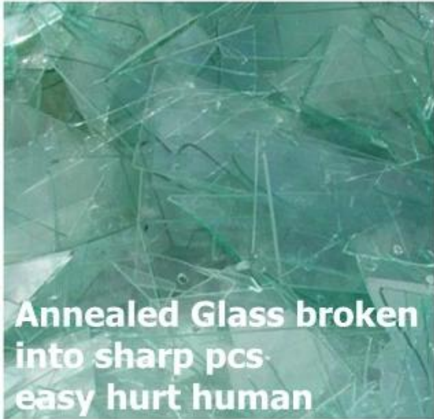
Annealed Glass broken into sharp pcs easy hurt human