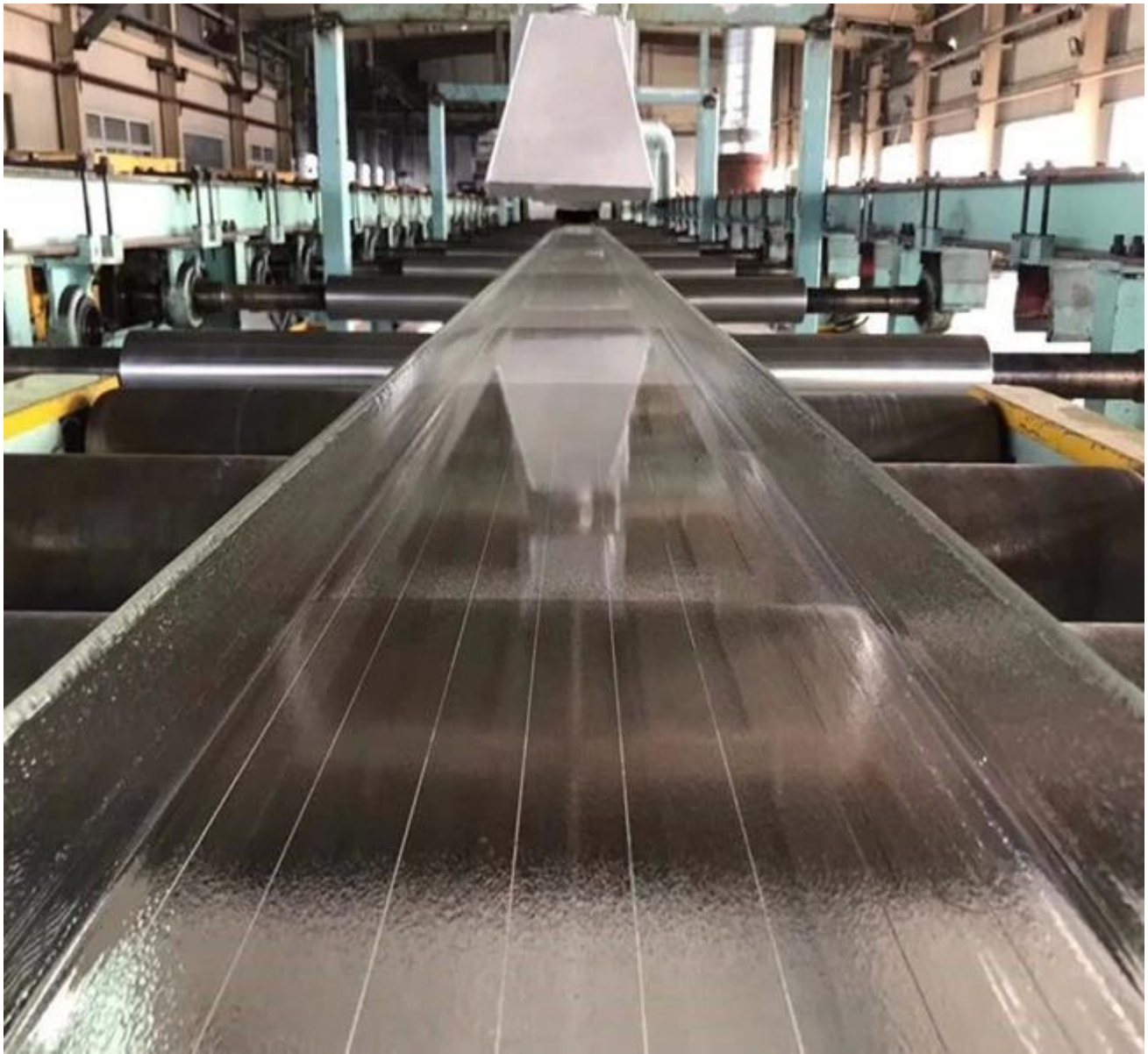
Stark Verpackung zum 7mm Super Weiß U Glas