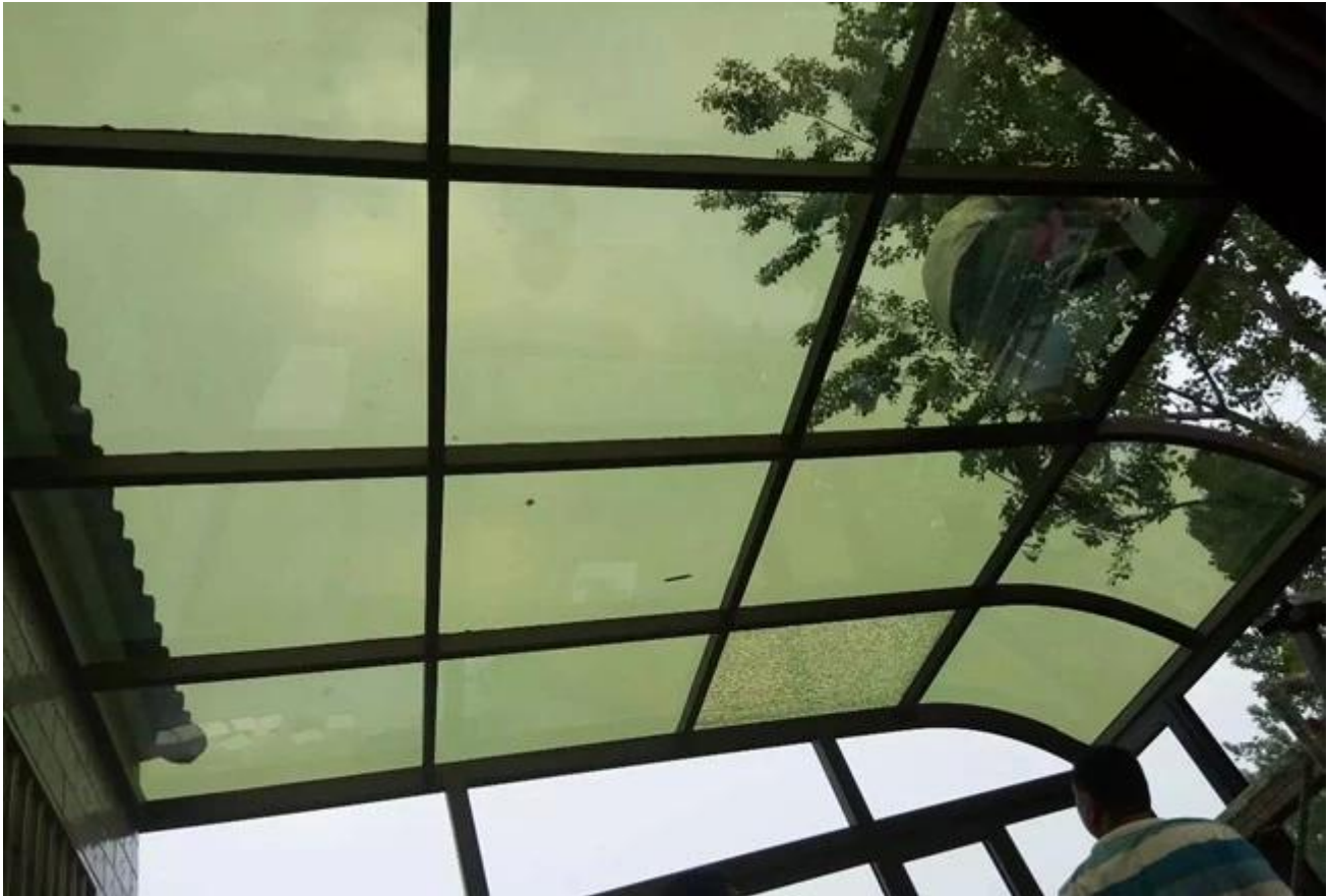
5mm dunkel grünes reflektierendes Glas Sicherheit Verpackung & laden