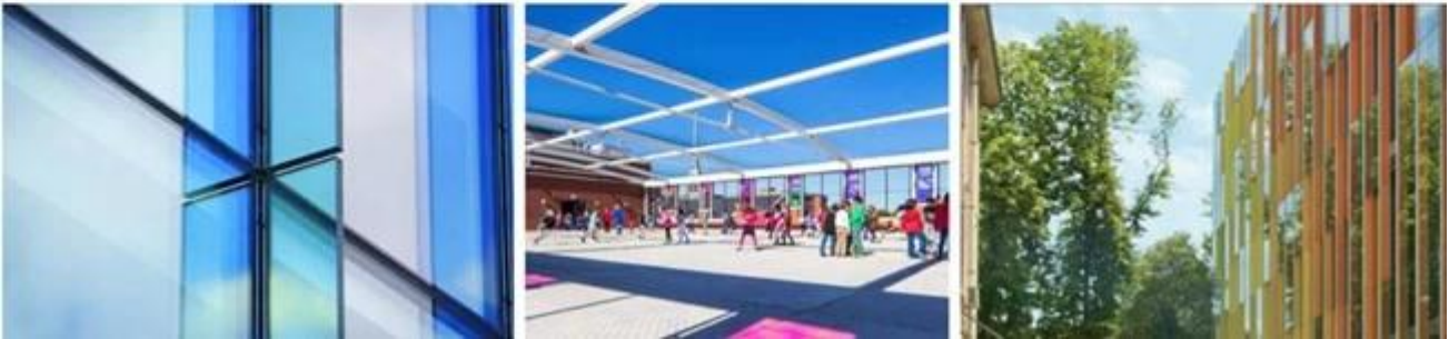
großes gehärtetes Glas, das auf Glaswandflossen verwendet wird