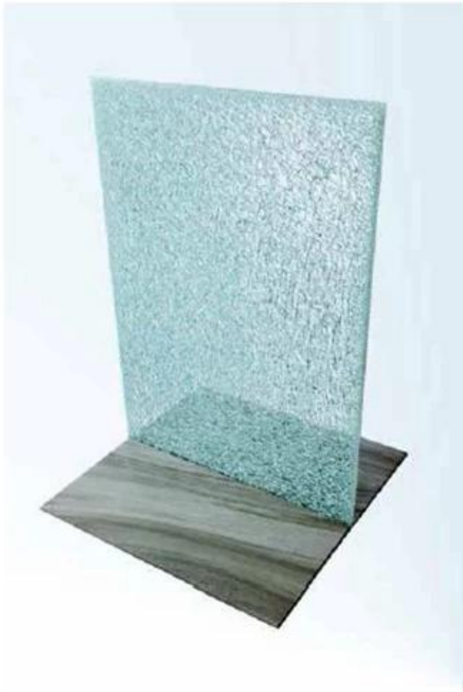
Laminated Glass with SGP Interlayer