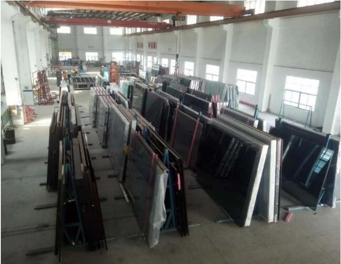
Glas-Verpackung von JIMY GLASS