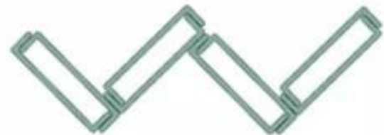
Double glazing arranged in zig-zag formation in pairs

U-förmiges Glasprojekt mit niedrigem Eisengehalt: