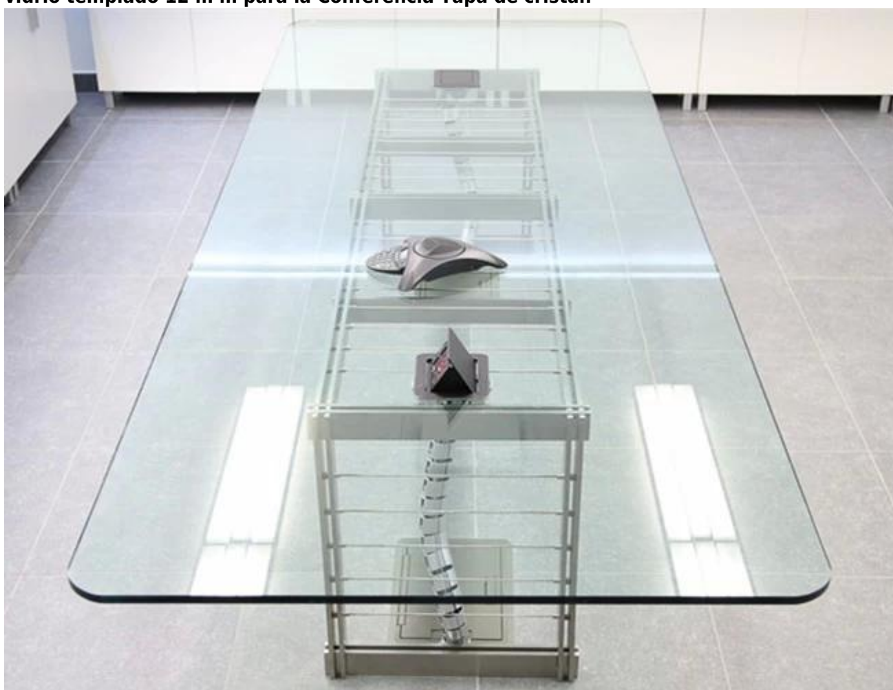
Embalaje de la seguridad y de carga para tableros de mesa de cristal templado 12 m m