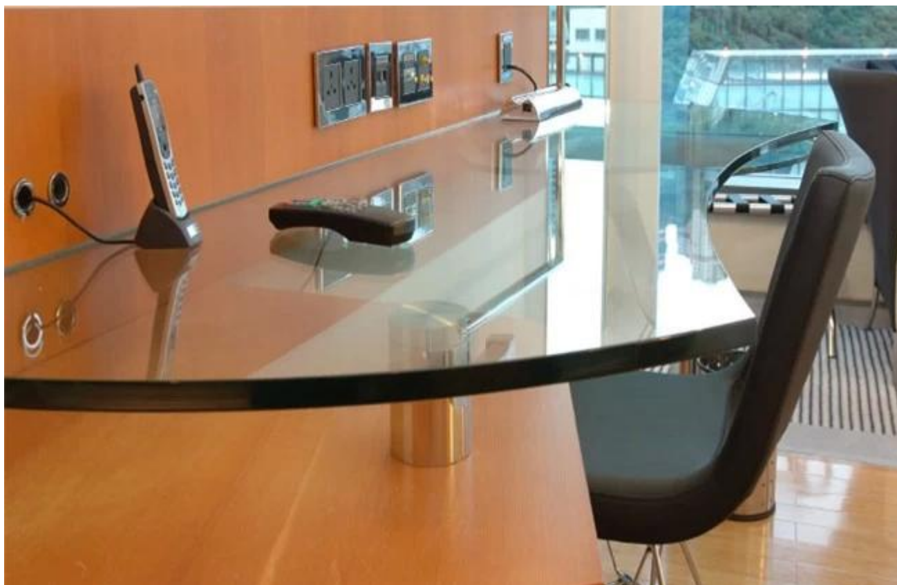
vidrio templado 12 m m para la Conferencia Tapa de cristal: