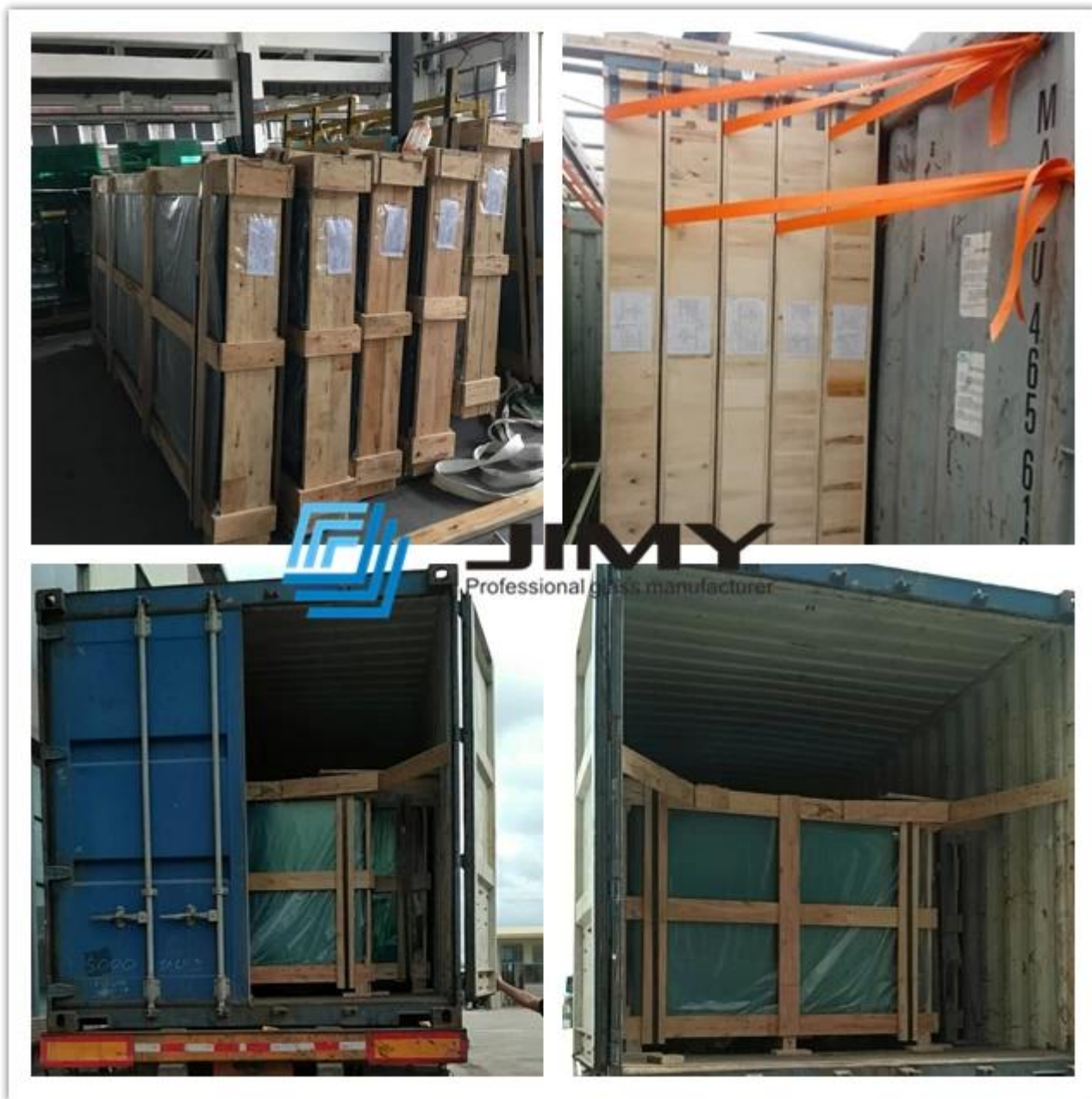
Proyectos con muro cortina de vidrio laminado verde y techo de vidrio, cúpula de vidrio