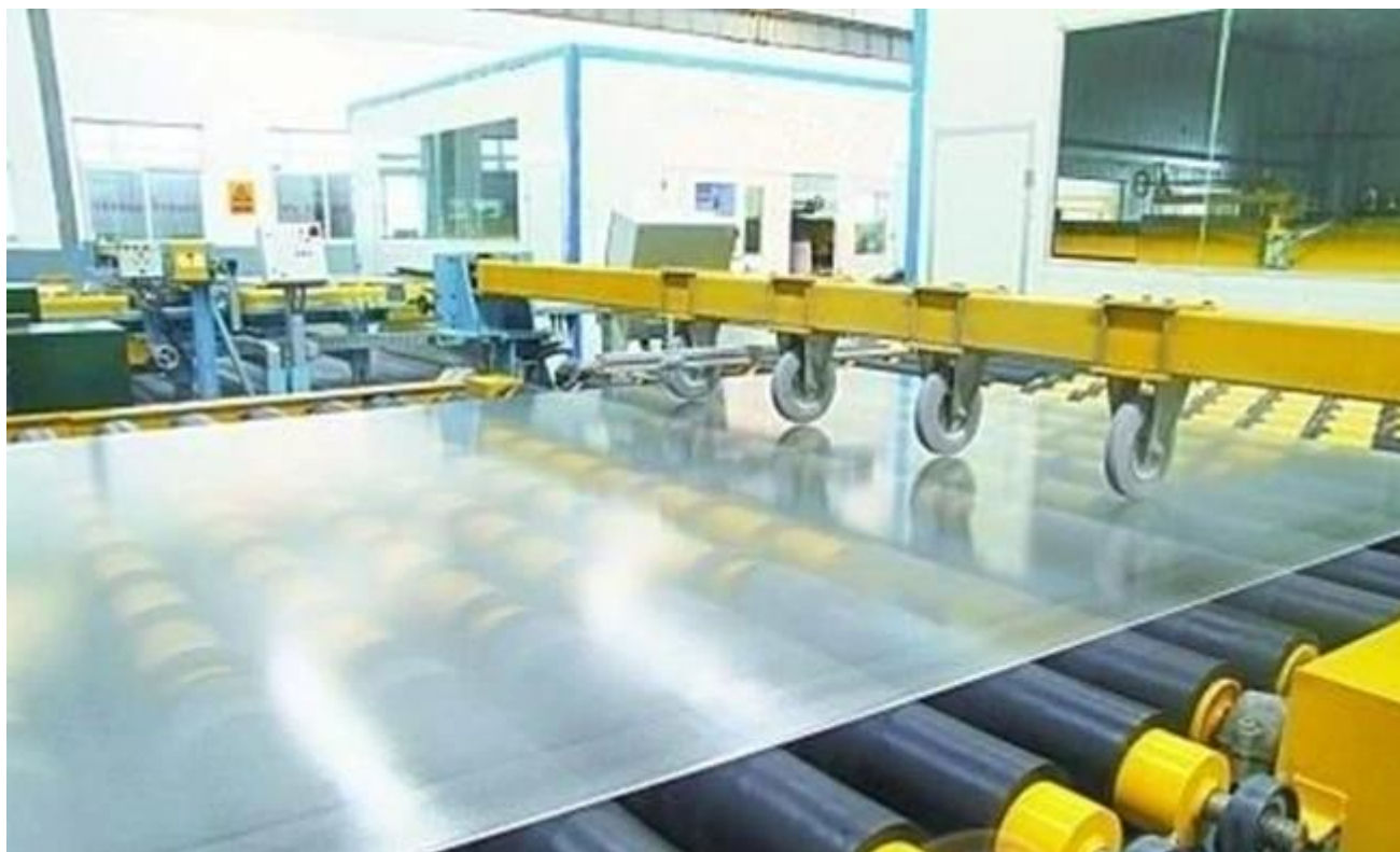
Vidrio modelado seguridad embalaje y carga