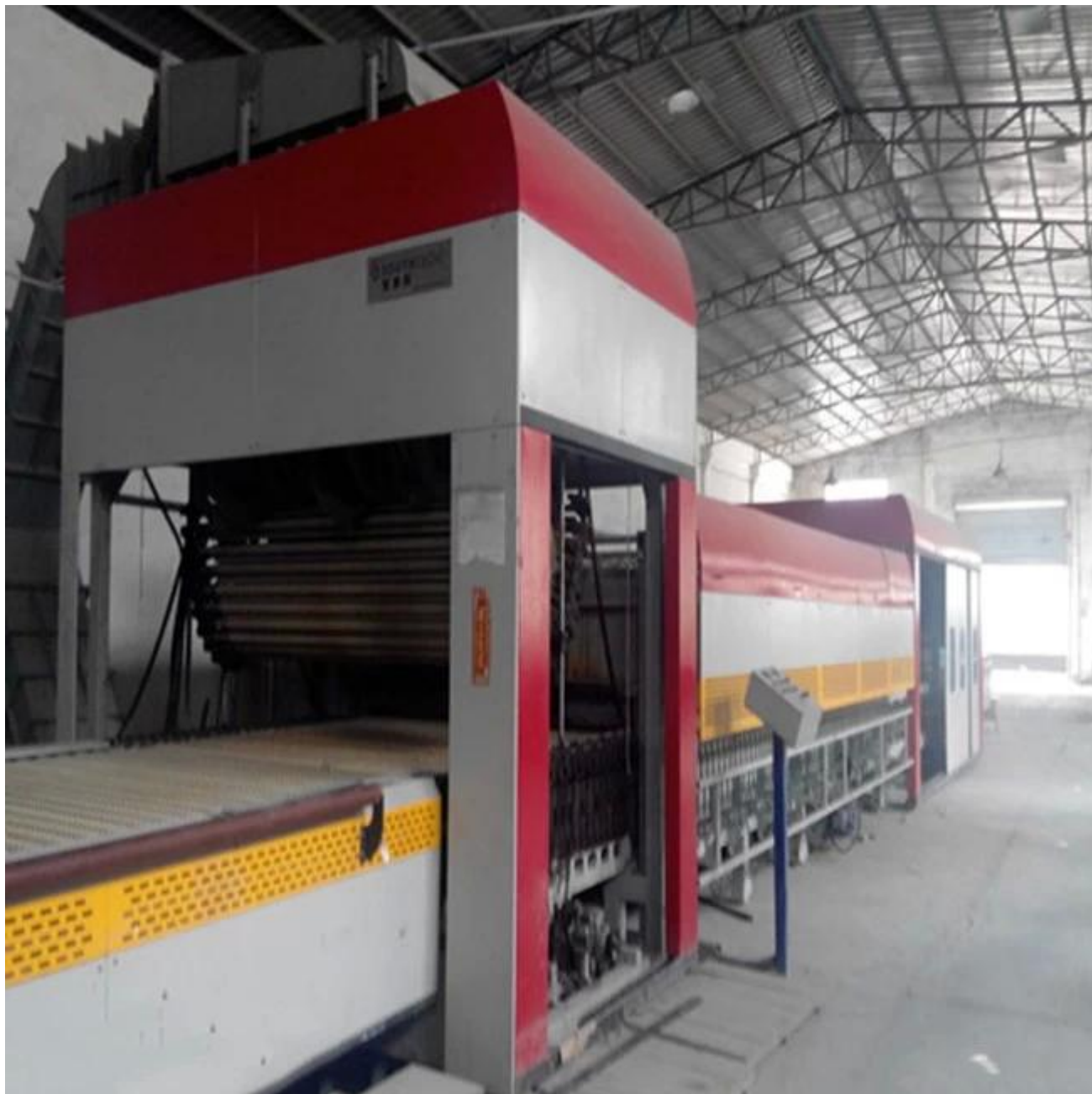
Planta de producción de vidrio laminado